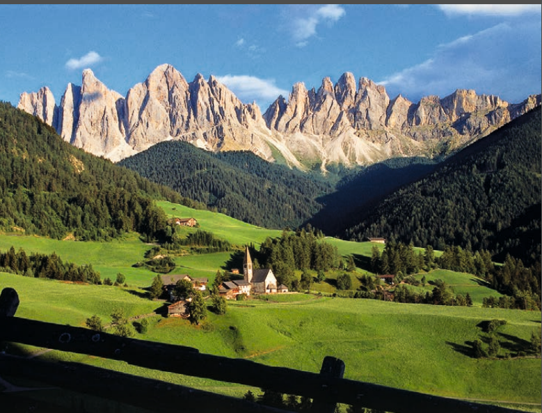
St. Magdalena in Villnöß mit den Geislerspitzen