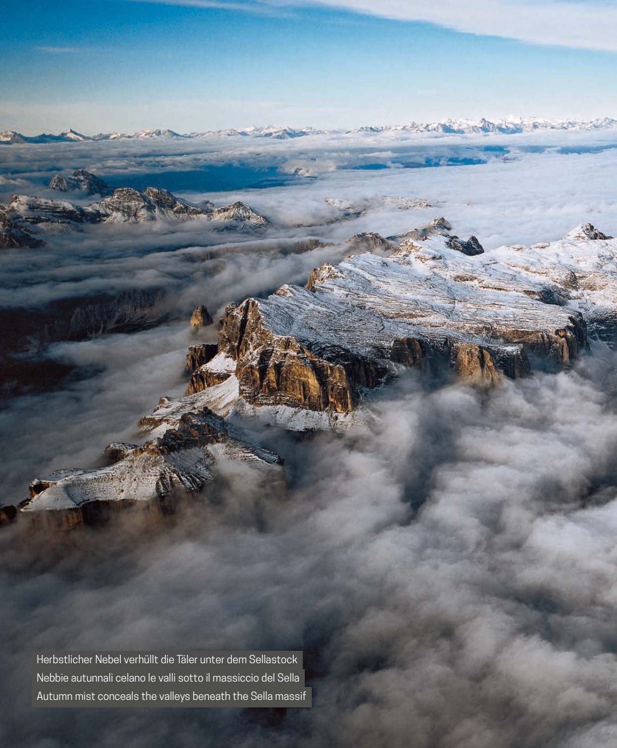
Herbstlicher Nebel verhüllt die Täler unter dem Sellastock Nebbie autunnali celano le valli sotto il massiccio del Sella Autumn mist conceals the valleys beneath the Sella massif