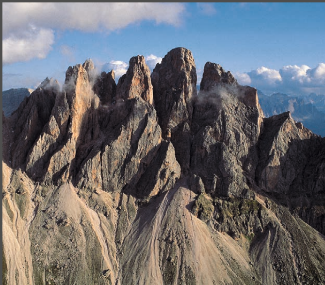
Die Fermedatürme in der Geislergruppe Le Torri del Fermeda nel Gruppo delle Odle The Fermeda Towers in the Geisler group