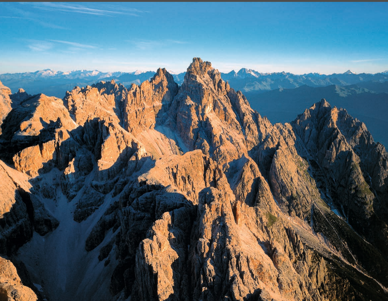
Der Gipfelaufbau der Dreischusterspitze Le guglie gotiche di Punta dei Tre Scarperi The peaks of the Dreischusterspitze