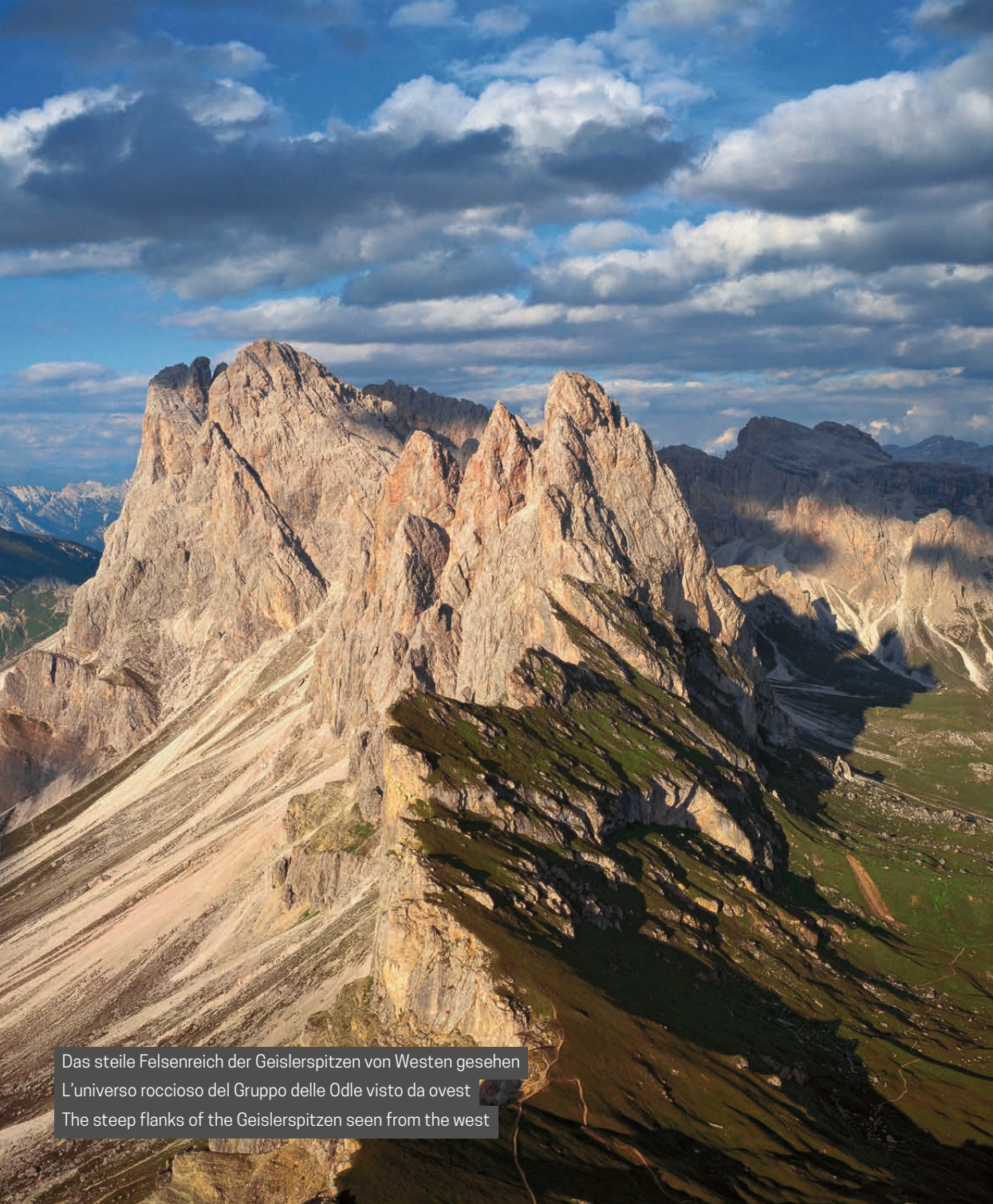
Das steile Felsenreich der Geislerspitzen von Westen gesehen L'universo roccioso del Gruppo delle Odle visto da ovest The steep flanks of the Geislerspitzen seen from the west