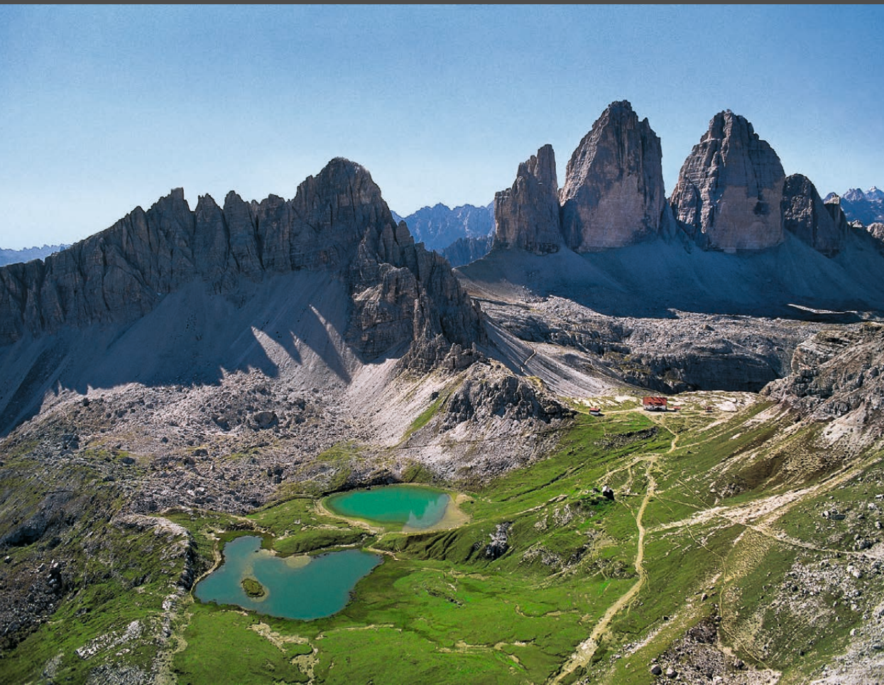
Die Bödenseen, die Drei-Zinnen-Hütte und die Nordwände der Drei Zinnen I Laghetti dei Piani, il Rifugio Tre Cime A. Locatelli e le pareti nord delle Tre Cime The Böden Lakes, the Drei Zinnen Hut and the north faces of the Drei Zinnen