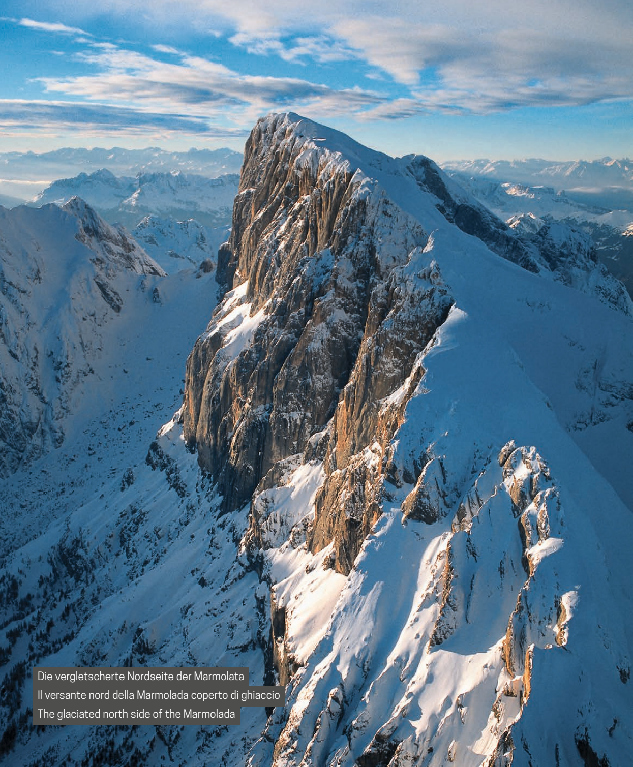
Die vergletscherte Nordseite der Marmolada Il versante nord della Marmolada coperto di ghiaccio The glaciated north side of the Marmolada