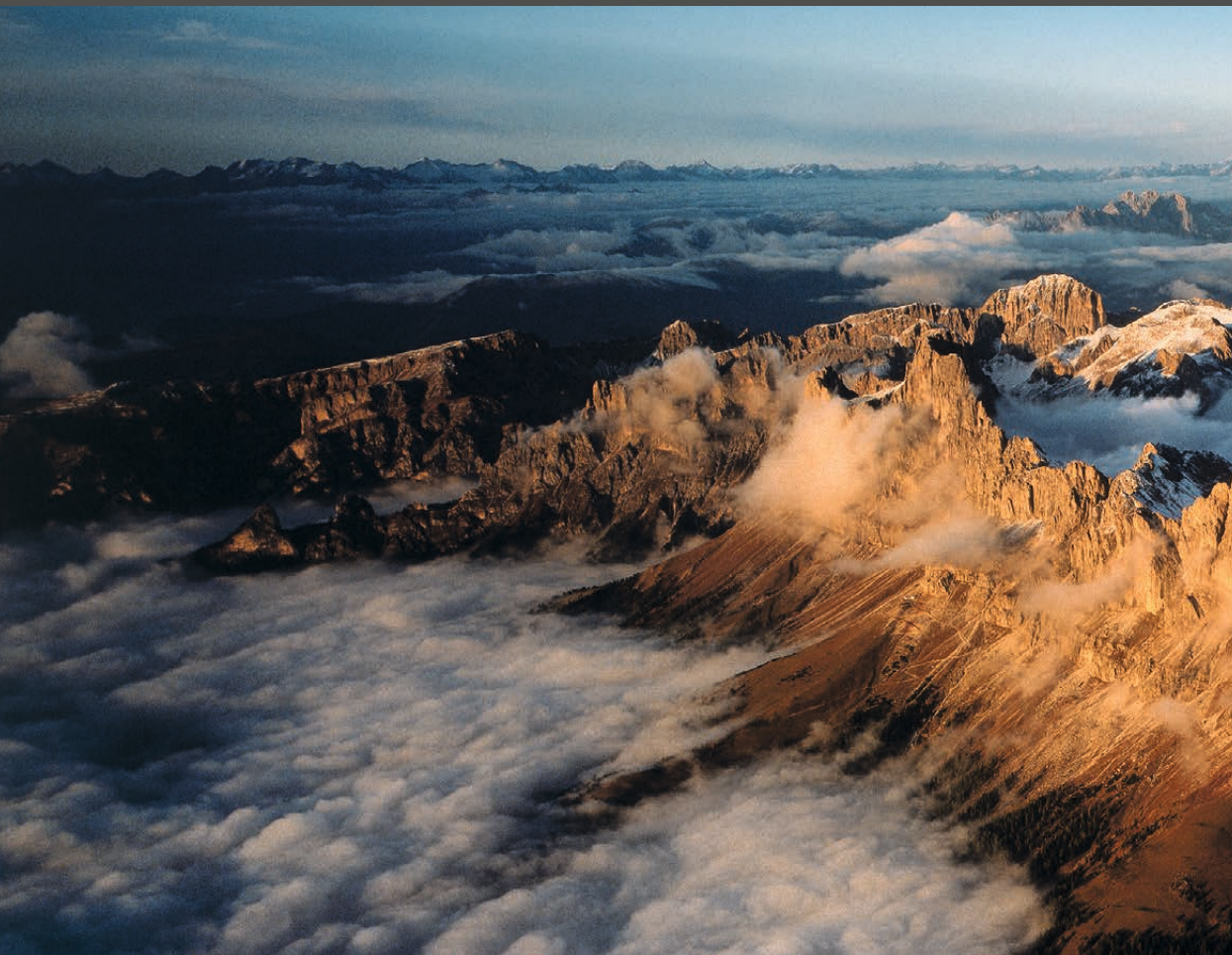
Der Rosengarten im Abendlicht L'ultima luce del tramonto sfiora il Catinaccio Evening light skimming over the Rosengarten