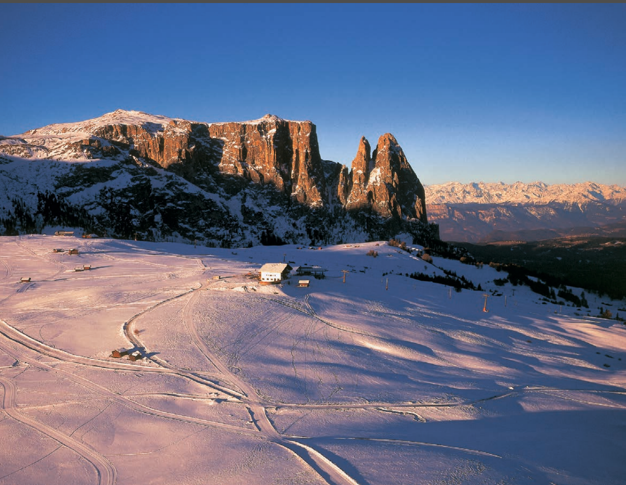
Die Seiser-Alm-Hochfläche und der Schlern L'altopiano dell'Alpe di Siusi con lo Sciliar The Seiser Alm plateau and the Schlern massif